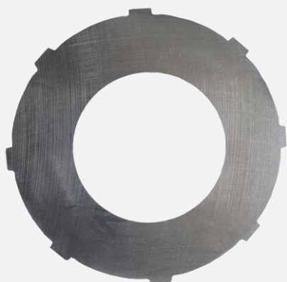
New Type-R/Silent LSD

※ 2014年9月、御要望にお応えして、150本の溝付き外爪プレート φ87用 R7A08-10/R7A08-20の2種類の生産を再開しました。